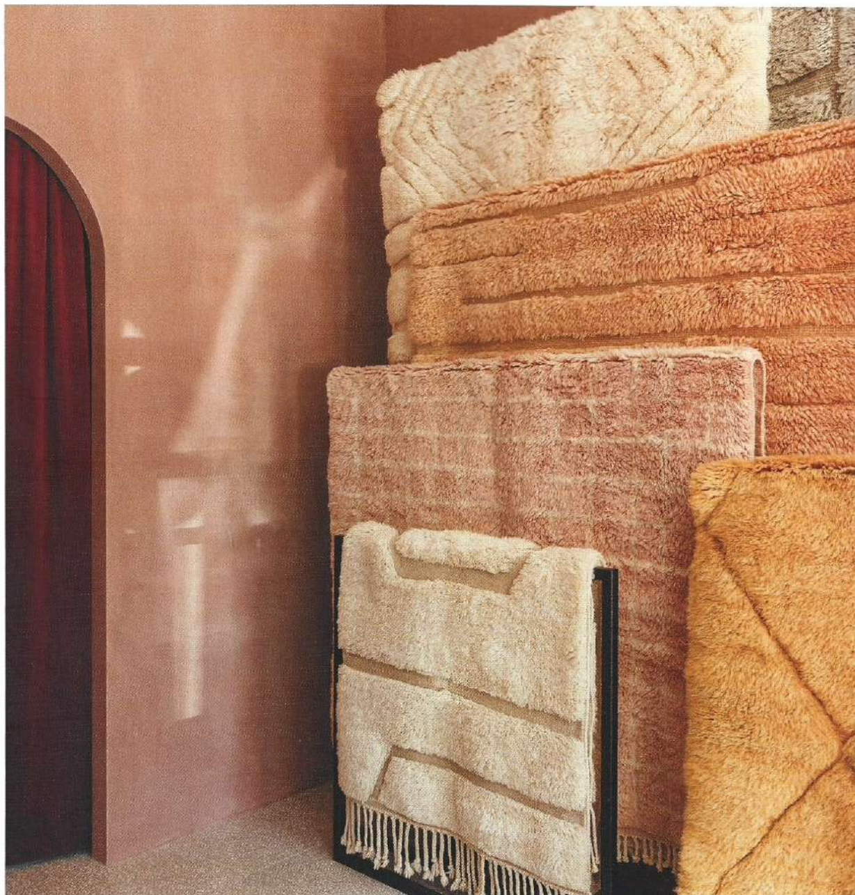
DYWANY BENI MRIRT z prowincji Beni Mallal łatwo rozpoznać. Mają runo długości nawet 10 centymetrów, poprzecinane tradycyjnymi motywami tkanymi na płasko. Z miękkiej wełny owiec żyjących wysoko w górach Atlas tworzą je utalentowane berberyjskie rzemieślniczki.